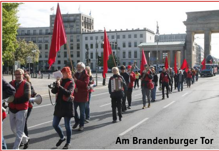
Am Brandenburger Tor