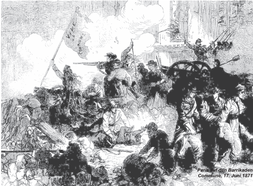
Paris auf den Barrikaden Commune, 17. Juni 1871

Die Rache an den Besiegten, die es wagten, die Revolution zu machen – wenn auch nicht in Gänze in der Pariser Commune – oder die Revolutionen sich den Sozialismus eroberten auf einem Drittel des Erdballs für die Befreiung der Arbeiter und Völker aus der Knechtschaft der Unterdrückung, ist eine unverhüllte, gesetzlose Rache einer Bourgeoisordnung, deren „Lebensfrage darin besteht: wie die Haufen von Leichen loswerden, die sie mordete, nachdem der Kampf vorüber war“ – Karl Marx. So wenig sie zurückschreckte, die von ihr besiegten Kommunarden zu Zehntausenden zu meucheln, so wenig kann sie ohne den Völkermord am Arbeiter, Bauern, Werktätigen, an mehreren Hundertmillionen durch ihre Kriege und Weltkriege bestehen, ohne erneut den vom Sozialismus garantierten Frieden und seinen gewaltigen Aufbau zur Befriedigung der Bedürfnisse seiner Menschen unangetastet zu lassen, so wenig schreckt sie