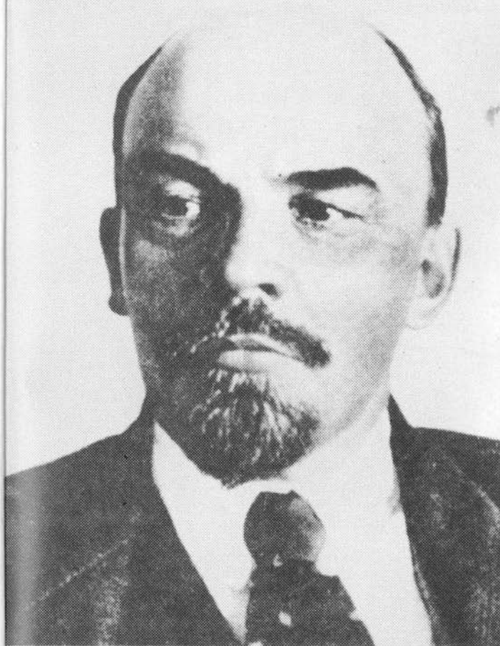
Wladimir I. Lenin