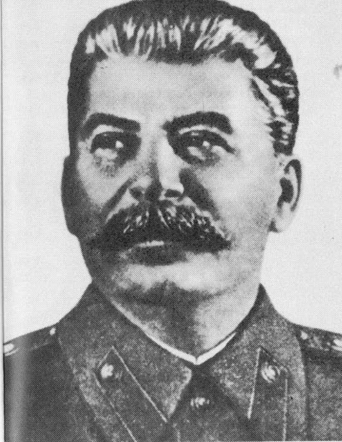
Josef W. Stalin