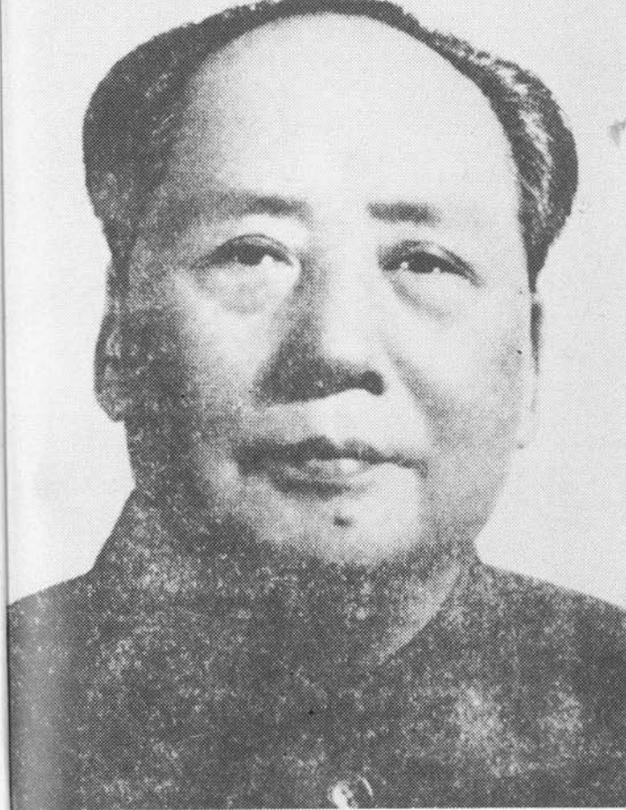
Mao Tse Tung